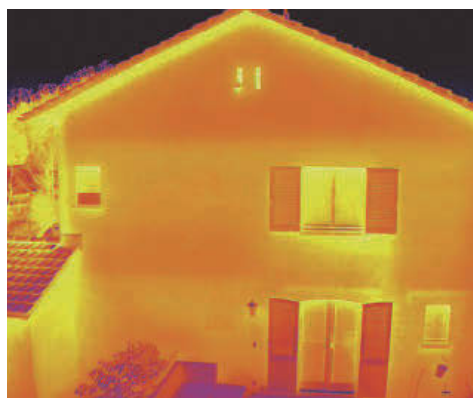
Mithilfe einer Wärmebildkamera können Wärme- oder Kältebrücken erkannt werden.