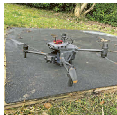
Mit dem 200fach-Zoom können auch weiter entfernte Beschädigungen untersucht werden.