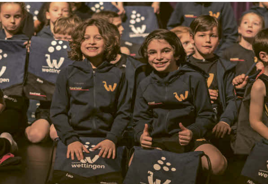
Übergabe der personalisierten Gymbags an die Turnerinnen und Turner des TV Wettingen.