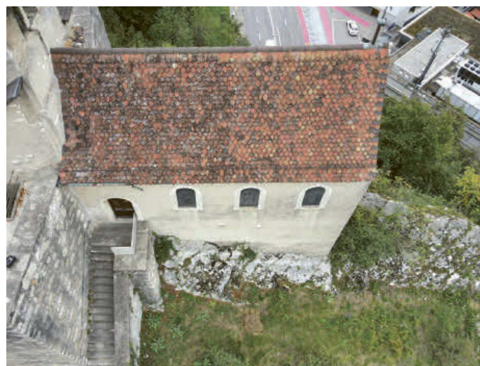
Mit einer Drohne können auch historische Gebäude, z.B. die Ruine Stein in Baden, aus der Luft untersucht werden.