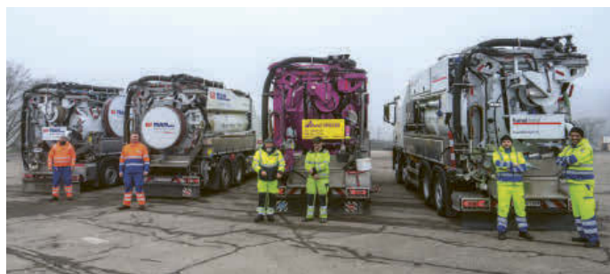
Stolz präsentieren unsere Mitarbeitenden ihre vier neuen Spül- und Sauglastwagen.